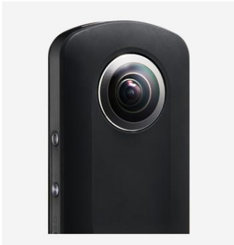
360° カメラ:RICO THETA S