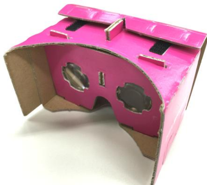
ゼクシ立体スコープ組立て後